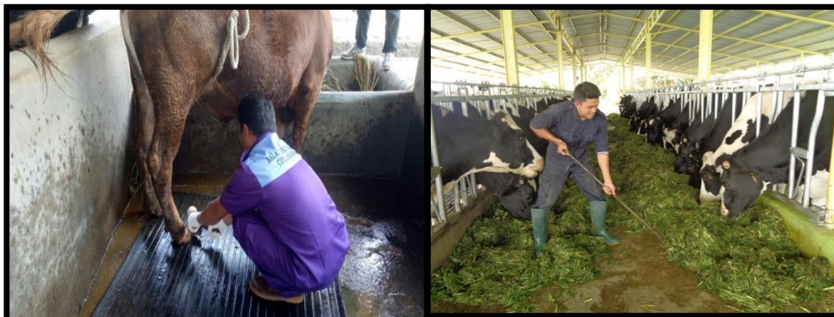
Pegawai kontrak/harian berasal dari masyarakat sekitar