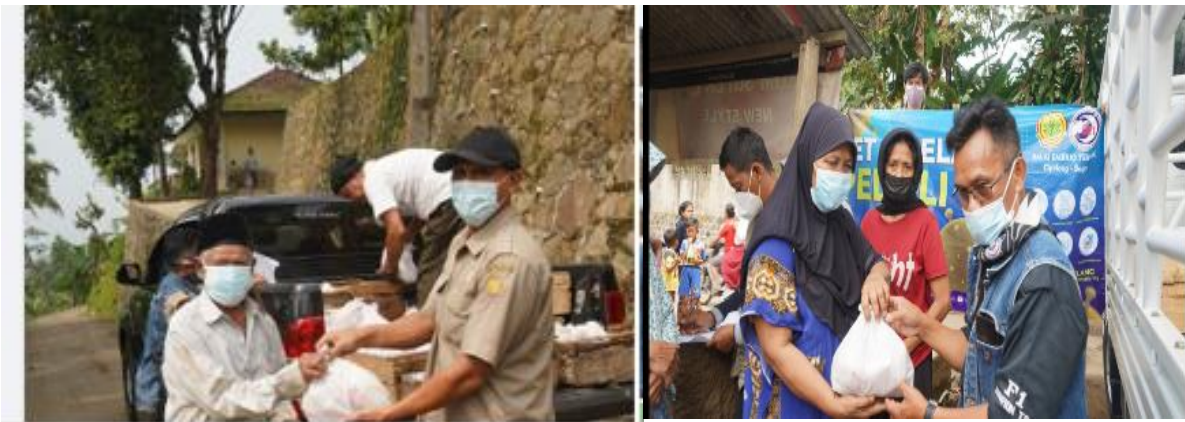
Pemberian bantuan peningkatan daya tahan tubuh (protein, vitamin, masker, hand sanitizier)