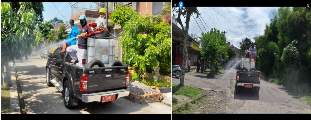
Penyemprotan desinfektan di lingkungan sekitar BET