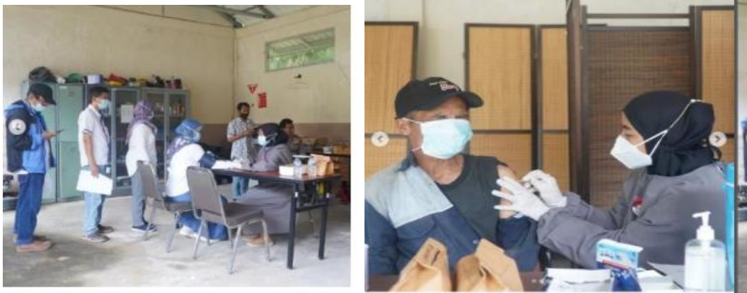
Vaksinasi Covid-19 seluruh pegawai dan masyarakat sekitar