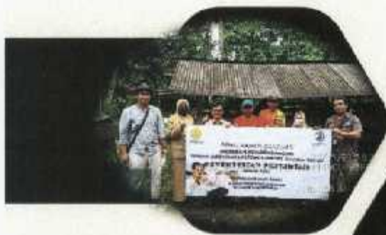
Distribusi Bantuan TA 2021