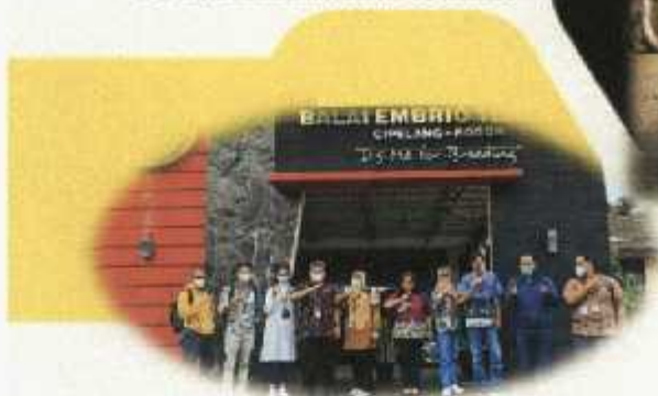
Pendampingan Penyusunan laporan PIPK