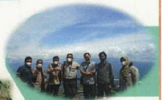
Kunjungan kepal BVET Banjarbaru