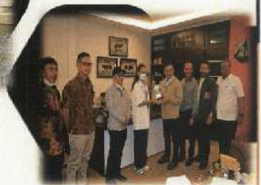
Kunjungan Kerja Bupati Solok Selatan