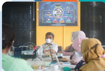
Pemutakhiran Data TLHP oleh Tim Inspektorat Jenderal