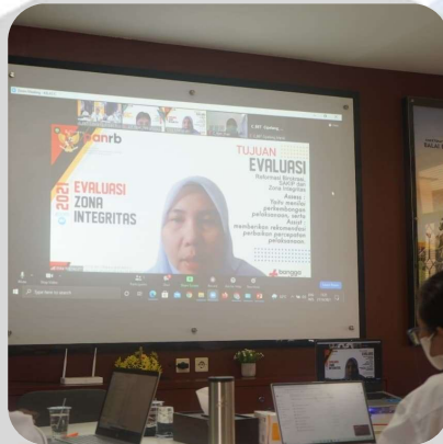
Evaluasi Zona Integritas Menuju WBBM Tahun 2021 oleh KemenpanRB