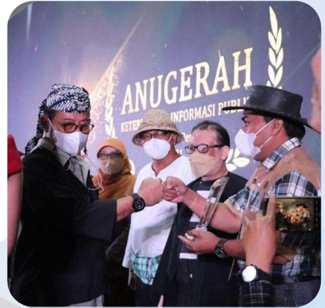
BET Raih Peringkat 1 keterbukaan Informasi Publik Tahun 2021 tingkat Eselon 3 kementerian Pertanian