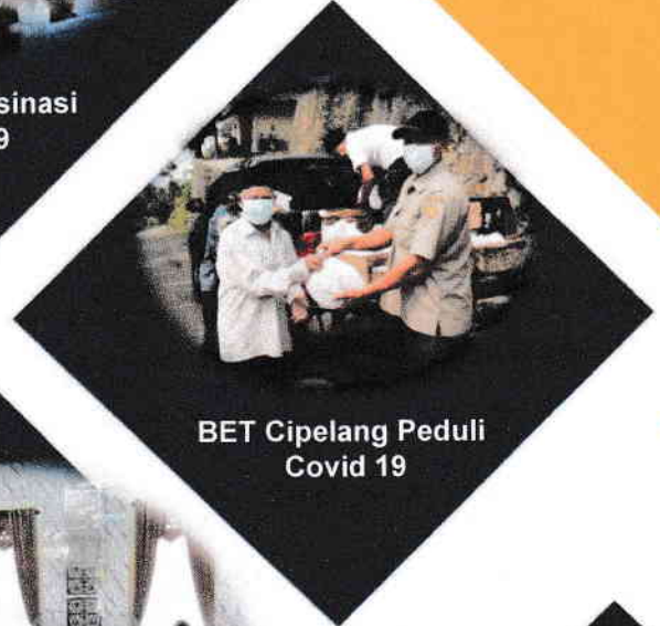
BET Cipelang Peduli Covid 19