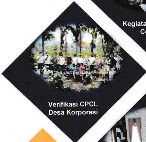
Verifikasi CPCL Desa Korporasi