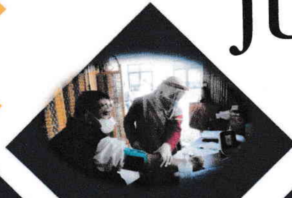
Kegiatan Vaksinasi Covid 19