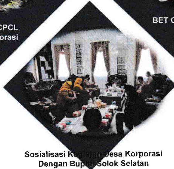
Sosialisasi Kegiatan Desa Korporasi Dengan Bupati Solok Selatan